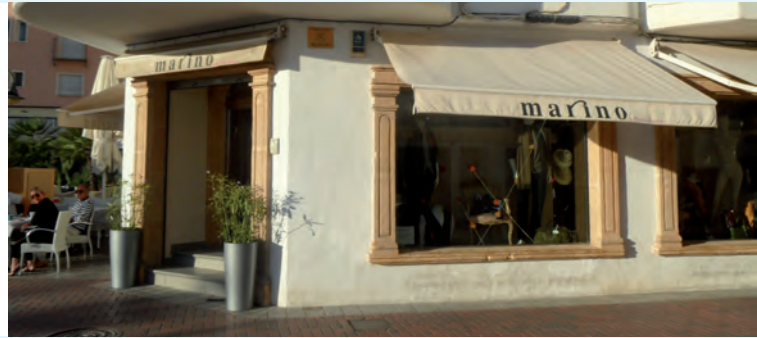
Aquí estuvo la oficina de la Caja Provincial