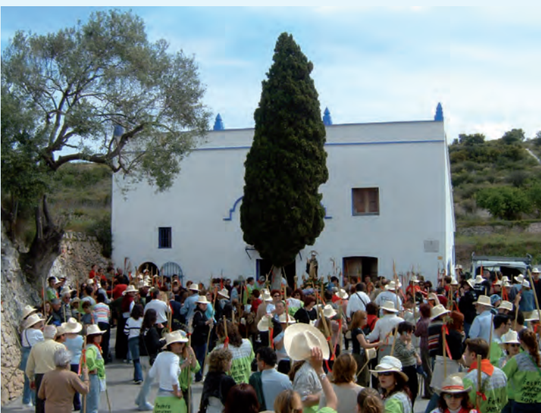
Romería a la Font Santa

El 23 de junio es la noche de la Joanaina . Fiesta de las hogueras que se conmemora en los