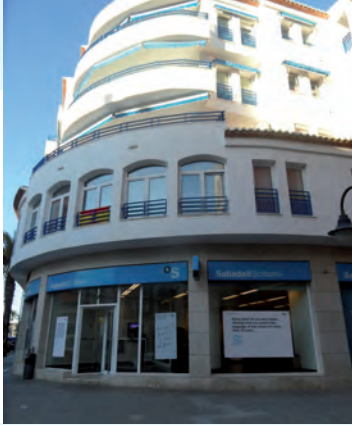
En la actualidad