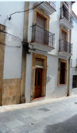
Aquí estuvo la primera sucursal

1954. El diario Información publicó el martes 5 de enero una reseña titulada: “Inauguró la Caja de Ahorros del Sureste de España una sucursal en TEULADA” y el cronista continúa su prosa de este estilo: “El segundo día del año ha encontrado a la Caja en el camino, en la ruta emprendida a ese ritmo sosegado, pero sin pausa que la lleva a una línea de peregrinar de buena voluntad por todos los vientos de las provincias de Alicante y Murcia” . Añadimos, por nuestra parte, que el 2 de enero fuera sábado, en todo caso jornada muy peculiar para una inauguración. “En Teulada hacía frío, había llovido y a las 6 de la tarde recibían las autoridades, jerarquías locales, Junta de Gobierno de la oficina a inaugurar y mucho público...” . Y seguimos transcribiendo: “La Caja está instalada en la calle José Antonio, número 5. La oficina es reducida. Se ha aprovechado la bonita decoración de una típica casa acomodada para montar los despachos que tienen cierto ambiente íntimo en el que se pierde el concepto frío de los números y la contabilidad” . Otras fuentes recuerdan que hubo un acto masivo, popular, en el cine de la Sociedad Recreativa Cultural y que en algún lugar se sirvió un refrigerio “para todo el mundo que quiso sumarse al acontecimiento”.