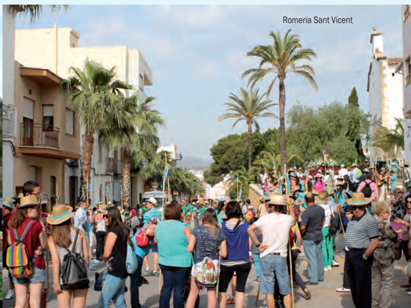
Romería Sant Vicent