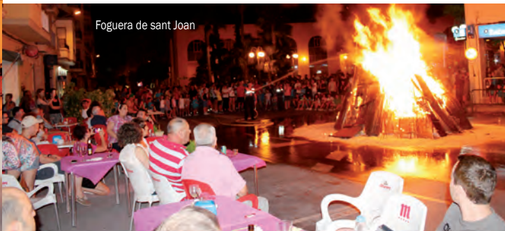
Foguera de sant Joan